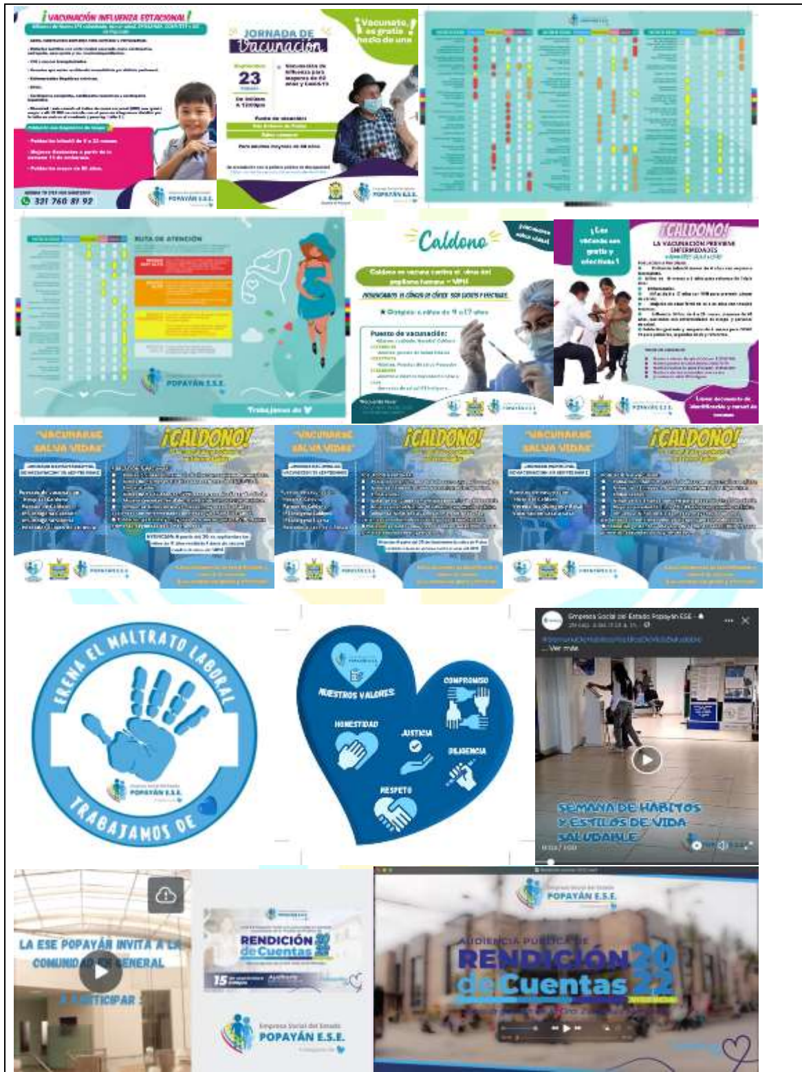
Piezas: 20 (infografías e imágenes) Videos: 3 piezas audio visuales Piezas sonoras: 2 Cuñas radiales (Caldono)