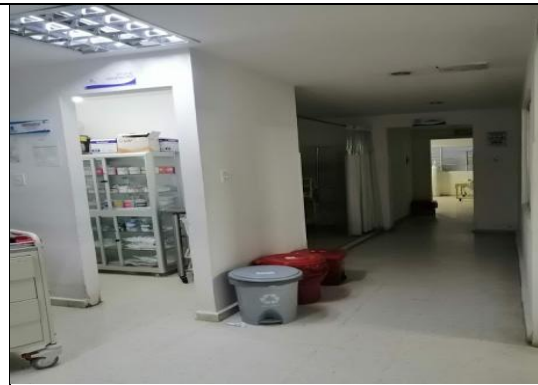
Centro de Salud Pescador.